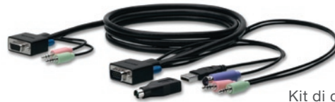
Kit di cavi SOHO inclusi nella confezione