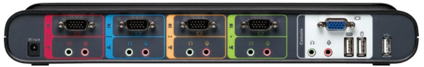
Modello illustrato in alto: F1DS104Lea.