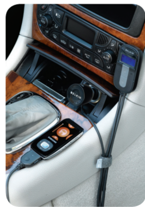
Samsung T9 not included Lifetime Warranty