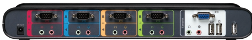
Le modèle illustré est la référence F1DS104Lea.