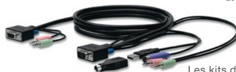
Les kits de câbles sont inclus dans la boîte.