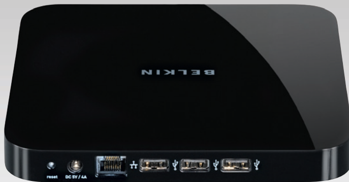
REINICIO ALIMENTACIÓN ETHERNET USB