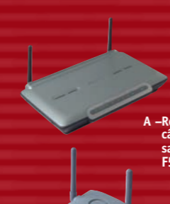
A - Routeur câble/ADSL sans fil F5D6231fr4

Utilise le port USB de votre ordinateur de bureau ou portable pour se connecter à un réseau sans fil