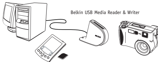
Belkin USB Media Reader &amp; Writer